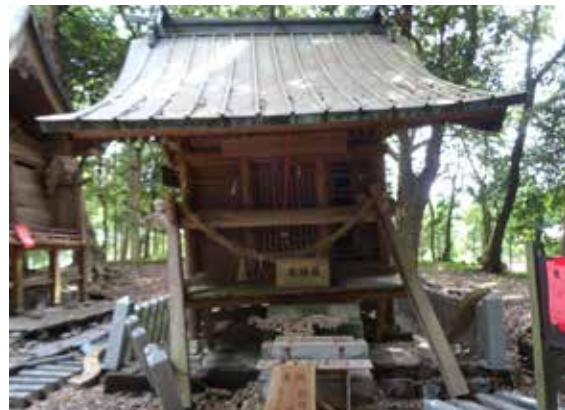
【雨宮】被災直後の様子

倒壊は免れましたが、向拝の倒壊、身舎の基礎石からの脱落による土台の折損などが確認されました。復旧に際しては、破損した部材の修繕・取替はもとより、曳家で高さや回転の捻じれ等の補正を行い元の位置に据え戻しました。