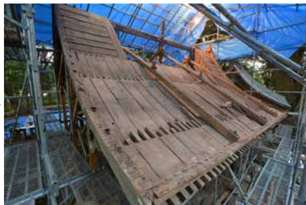
②小屋組の解体完了。