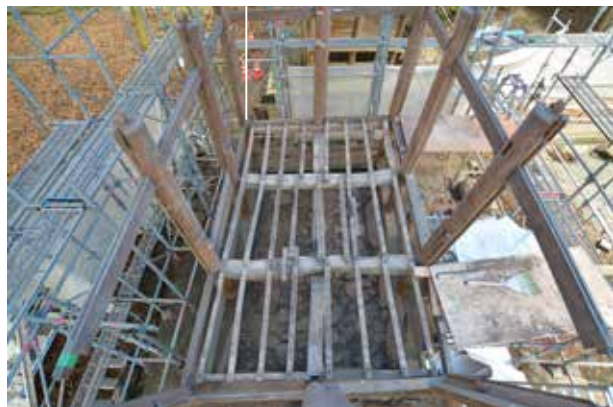
⑤床板や床組の解体状況。中央部に小火の痕がありました。幾多の苦難を乗り越えてきたようです。