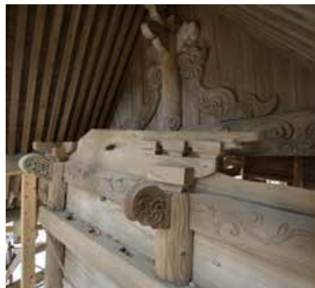
【本殿】倒壊した基礎石と滑動した躯体 【本殿】折損した隅柱 【本殿】軸組から脱落した屋根組