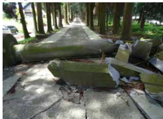
【鳥居】被災直後の様子

・その他 玉垣の倒壊、鳥居の倒壊、手水舎の位置の移動、灯籠の倒壊、石段の孕み出しなど境内の構成要素の多くに被害が及びましたが、総ての復旧を完了しました。