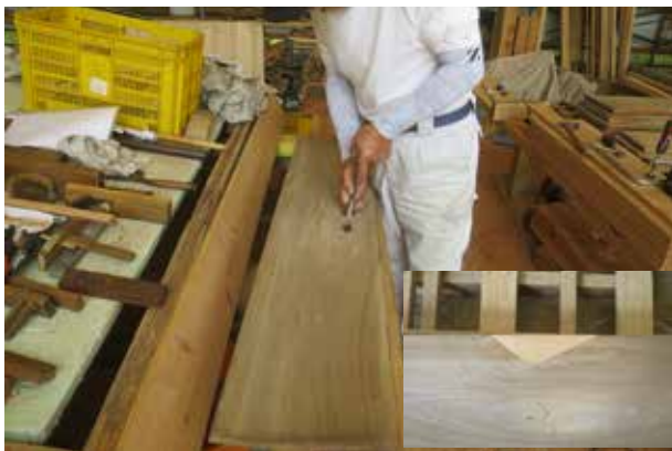
③板の割れや小さな欠けも丁寧に修繕しました。