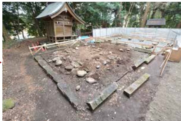
⑥基礎石まで解体を完了した状況