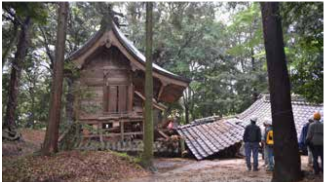
【八王社本殿・幣殿】被災直後 北面