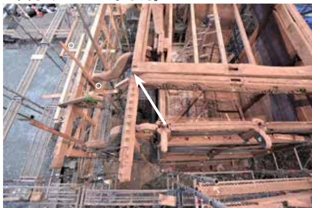
④跳ね上がった屋根が正規の位置から北西に約40cmほどズレていました。