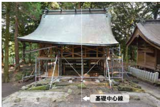
①解体前の本殿正面。屋根が躯体から外れ、北側に大きくズレていました。

発災から工事着工まで約3年半、仮補強で踏ん張っていた本殿の分解工事に着手しました。小さな板の一枚に至るまで、部材名称と番号を振り分け、部材を傷つけないように丁寧に解いていきます。3間社という小規模な本殿ですが、部材総数は大小含め約1,900点、材積約13 m 3 にも及びました。解体は上部躯体とともに、位置ズレや転倒をおこした基礎石や基壇までを行いました。