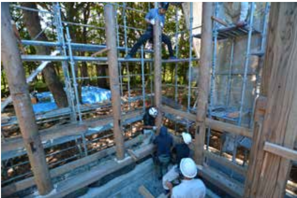
③柱を建て込む状況