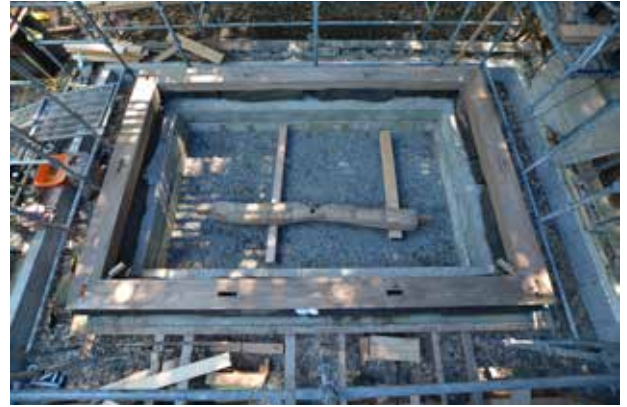
②土台の据え付けを完了