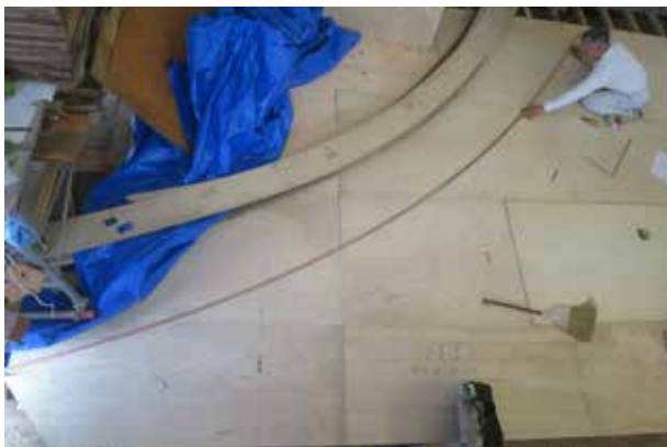
①部材実測により小屋組の寸法体系を整理。屋根の弛み曲線を調整しました。