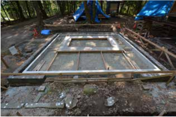
①基礎工事を完了した基壇

繕いを終えた部材を現場で組上げていく工程です。基礎は緩み易く不安定であった基壇ごと補強し、もとの礎石を据え戻します。石の凹凸に合わせて土台の下面を削り合わせたら、いよいよ柱を建て込みます。横貫が交錯するので建てる順序を間違えるとうまく組み上げることが出来ません。また、組立ながら板を落とし込むので細かい調整を要します。もともと組み上がっていたものですが、木の歪みや反りなどを巧く見極めないと組み上がりません。再建には新築とはまた別の技術が求められます。