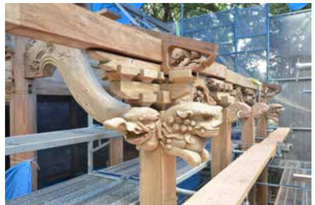
⑥組み上がった向拝の斗拱。発災時に倒壊した部分ですが、総ての材を再用することが出来ました。