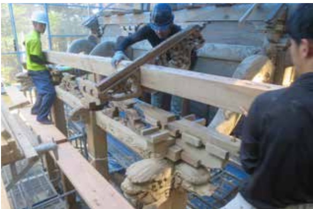
⑤向拝を組上げる状況。手挟みは桁の木口から差し込むつくりになっていました。