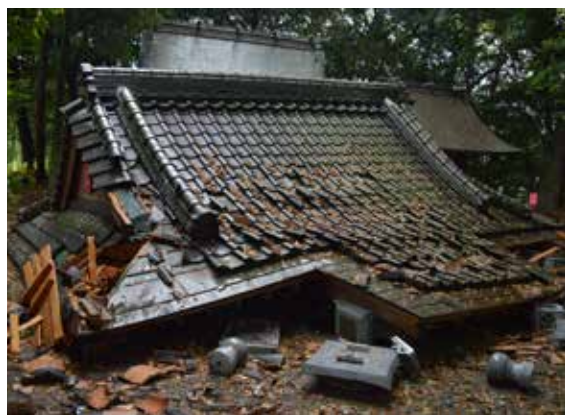
【拝殿】被災直後の様子

本震により完全に倒壊した影響で、部材の損傷が大きく、多くの部材を取り替えざるを得ませんでした。復旧に際して拝殿不動沈下の顕著な基礎にはベタ基礎補強を施し、礎石を一体的に拘束しました。軸部は本殿同様、損傷の見られる部材の取替と根継・修繕等を行いながら、壁の補強・床構面や屋根構面への耐震補強を行いました。小屋組は平成 22 年の屋根替え時に取り替えられた部材に構造的に欠陥が確認されたため、補足部材により小屋組の構成を改めました。また、元々水平梁がないことや、隅木を丑梁で吊って支える特殊な構造により、瓦屋根に対する構造耐力を担保できないと判断し、銅板屋根と改めました。