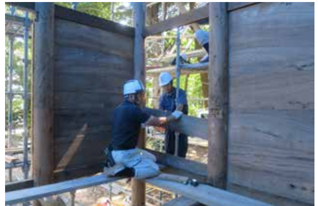
④落とし込み板を嵌め込む状況