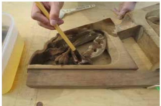
④表面劣化が進行したクスの彫刻部材に膠を含浸させました。