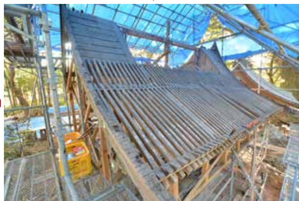
③垂木や野地板の解体状況。著しい漏水は見られず、比較的健全な状態を保っていました。