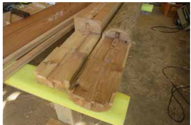
②柱の根継の仕口。強度上問題がない箇所で見え掛りに配慮し目地を包み込む形状としました。